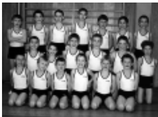
Die Turnschüler in ihren neuen Trikots

Herzlichen Glückwunsch für die guten Ergebnisse in diesem Wettkampf.